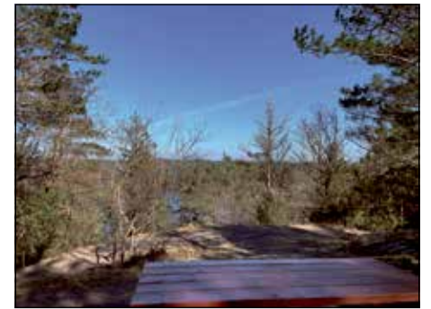
HÄR BEHÖVER RÖJAS för att kunna njuta av utsikten.