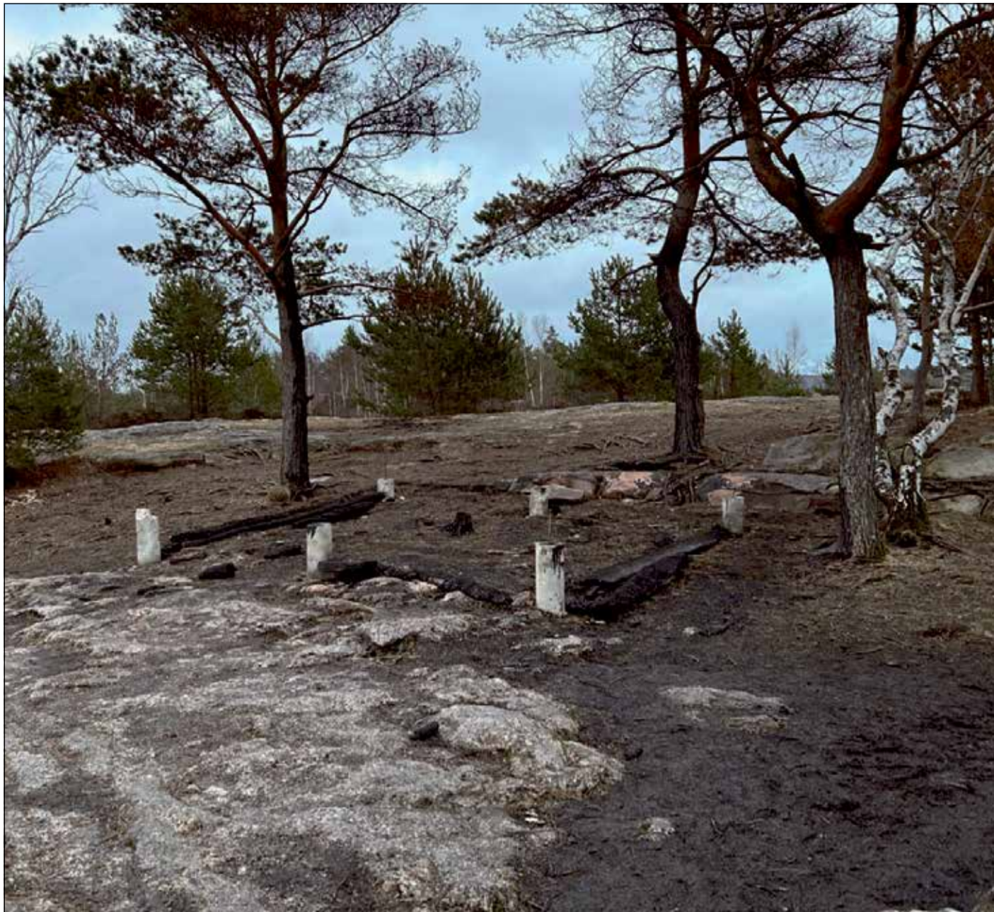
RESTERNA AV GÖTT LÄGE! När blir invigningen?