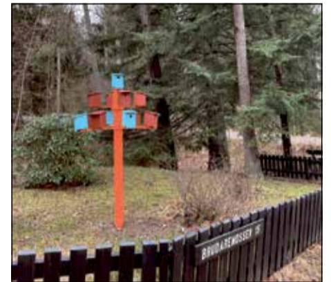
NYTT "GRUPPHUSOMRÅDE" i Delsjöskogen.