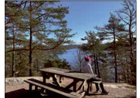
UTSIKTSPLATSEN ovanför trapporna – utsikten kan bli mycket bättre.