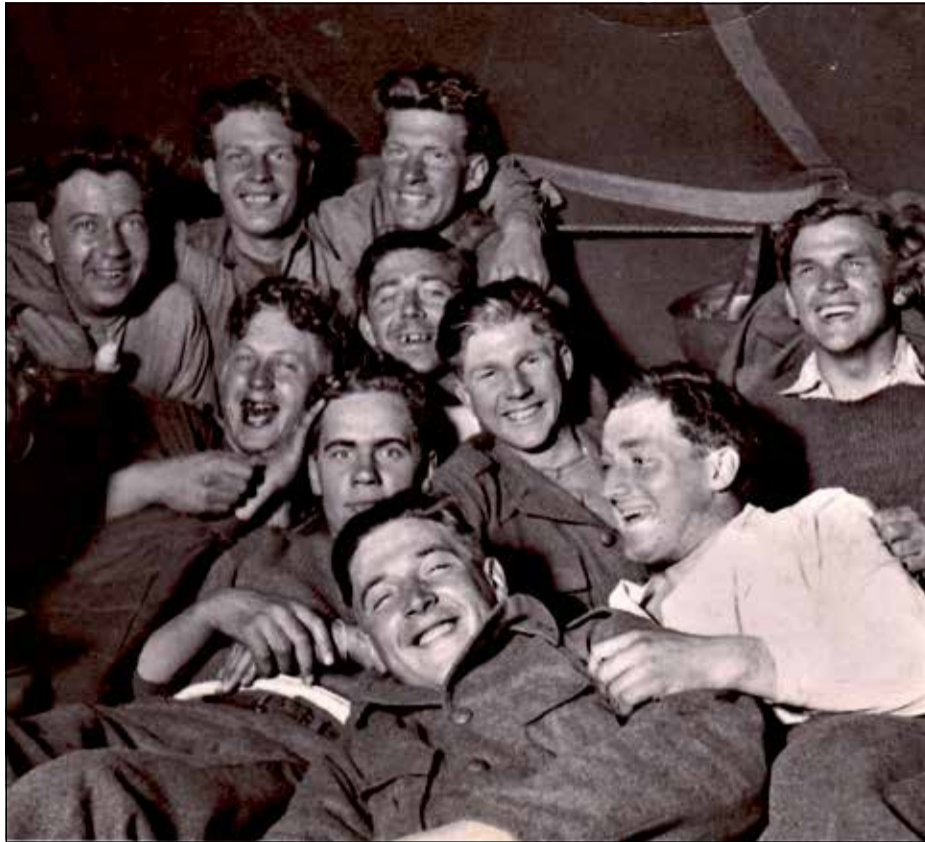
I TÄLT I FÄLT. Tio tappra och tämligen glada beredskapsoldater i tältet framåt kvällen. Ja, 1944 kunde de så smått börja tro på fred i Europa och att då från vårt långa lands många posteringar få komma hem till sina nära och kära.