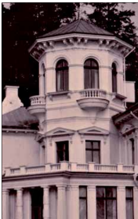
SWEDEN CALLING. Man kan undra hur många hemliga chifferade meddelanden som telegraferades ut ifrån Överås vackra hörntorn under andra världskriget. Inte så många som från Grimeton i Halland, men...

– Nja, sa Skarback. Tyska spioner, mer från