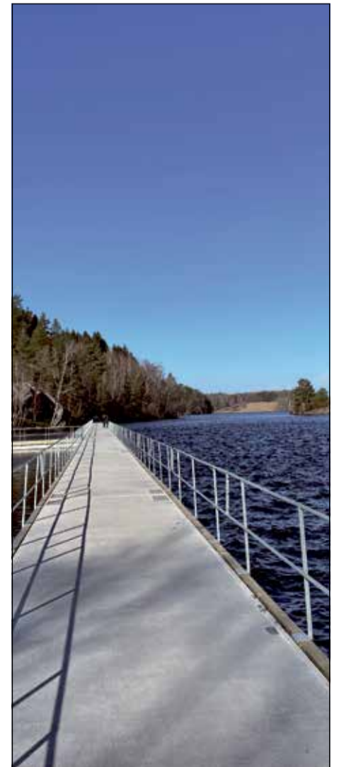
NYA SPÅNGEN, Delsjöbadet i bakgrunden.