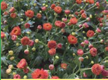
Krysantemum Fr 59:-

Nu är det dags att byta ut sommarblommorna mot lite härliga höstblommor!