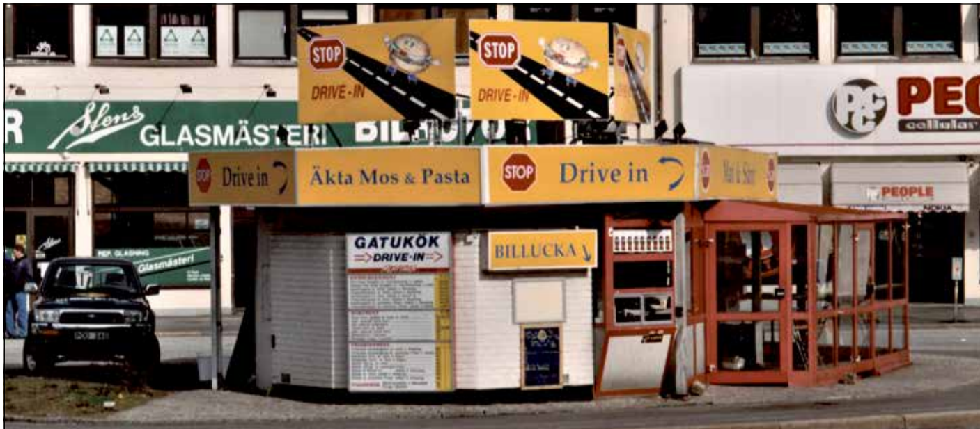
DRIVE IN. Odinsplatsen hade redan för någon generation sedan gatukök med drive in-lucka på typiskt amerikanskt manér.