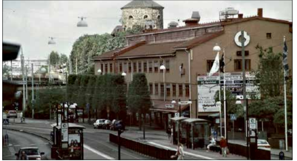
LITE MULET. Fridfullt vid hållplatsen Olskrokstorget en dag då folk tvekade att gå ut mellan regnskurarna.

Men, nåja, Trä-Ottos hade ju funnits ganska högt upp vid vägen, på samma sida som den legendariska bokhandeln Tre Böcker fanns på. Och den anrika men alltid hypermodernt