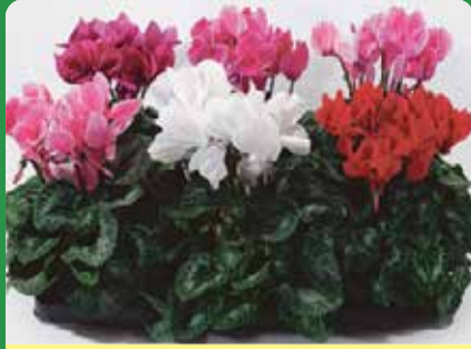
Cyklamen Fr 59:-