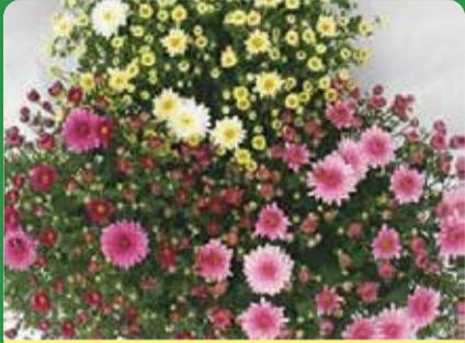
Bollkryss Fr 99:-

Vi har även massor av fina gröna växter Fr 59:-