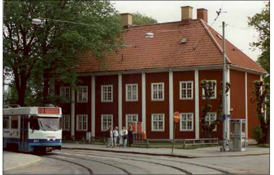
LÅNGELIGA TIDER. Huset kallat Mariagården har vid Stampgatan sedan 1700- och 1800-talens epok som fattighus också varit lungsjukhus och dispensär.

Innan ordet sponsor ens fanns i språket blev JW Lyckholms Bryggeri vid Skårs Led och Bröderna Kanolds chokladfabrik kolonins två stora sponsorer, dock med önskan att deras