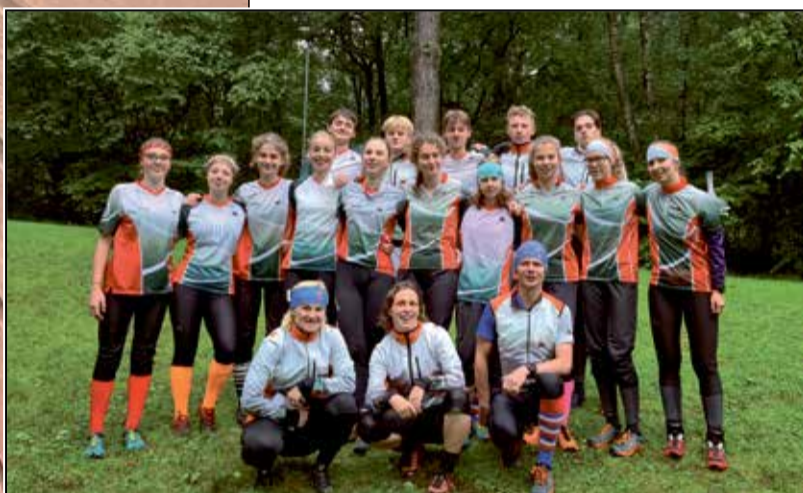
Tjeckiska Teamet samlat