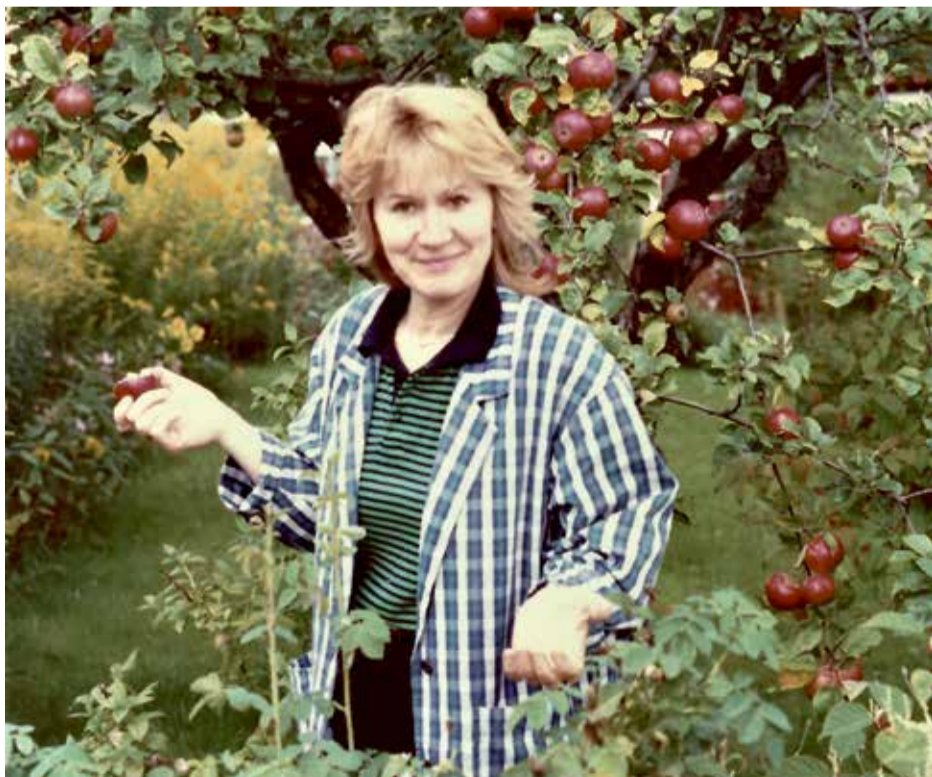
SENSOMMARLYCKA. Kolonist framför troget äppelträd på lott nr 55 under sent 1990-tal. Området hörde vid grundandet 1915 till Örgryte kommun.

Men i dagsläget, vid ingången till denna vädermässigt lynniga första höstmånad, återstår mycket av årets äppelskörd att ta hand om, skala och göra sylt av, så burkarna räcker för ens nära och kära ända till nästa års skörd.