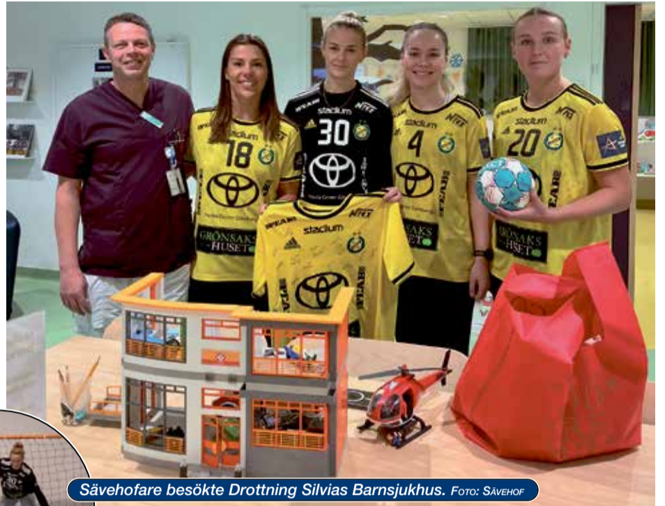
Sävehofare besökte Drottning Silvias Barnsjukhus.

Insamlingsstiftelsen för Drottning Silvias barnsjukhus arbetar för att skapa glädje för de barn och familjer som kämpar i sin vardag på Sveriges största barnsjukhus. När barn och unga drabbas av sjukdom behövs miljöer, upp-