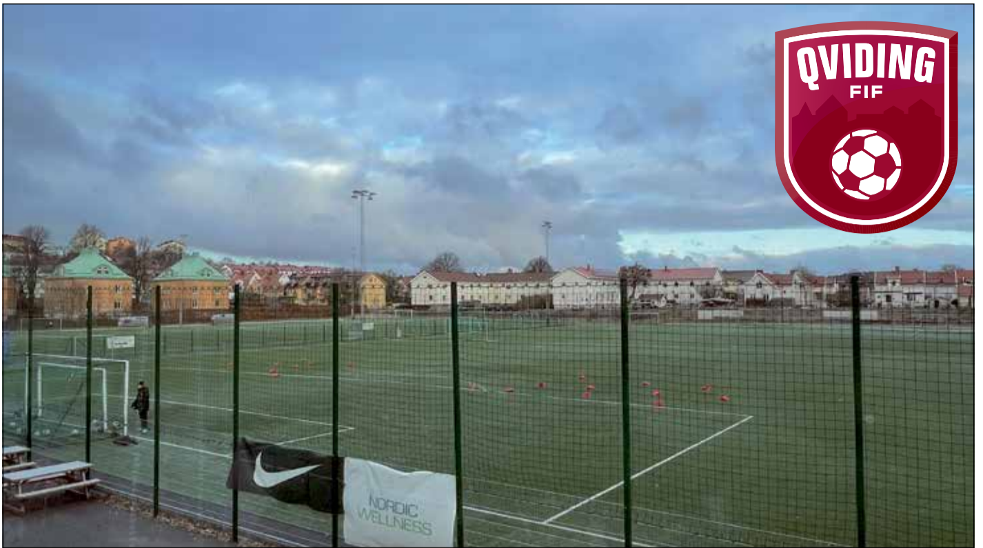
TVÅ FINA fotbollspåsar i anslutning till Härlanda Park.