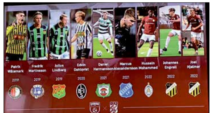
Många duktiga spelare i Qviding FIF som gått vidare i karriären.