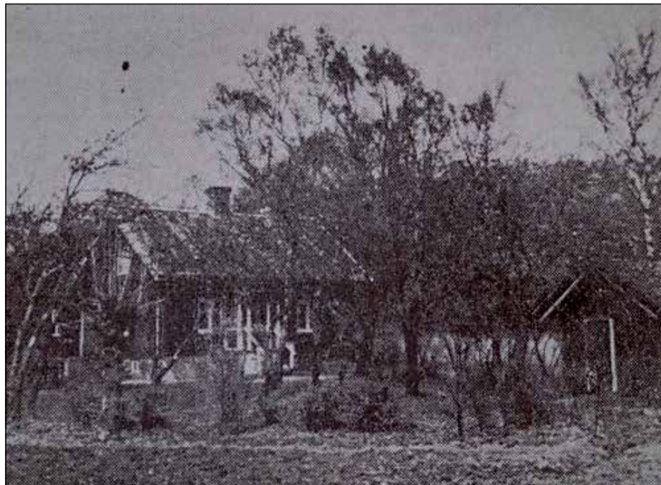
Intagan Smörslottet 3 juni 1950 ur Ny tid.