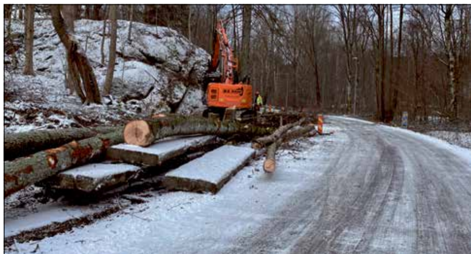
HÄR BYGGS DET gång- och cykelbana på vägen upp till Delsjöbadet.