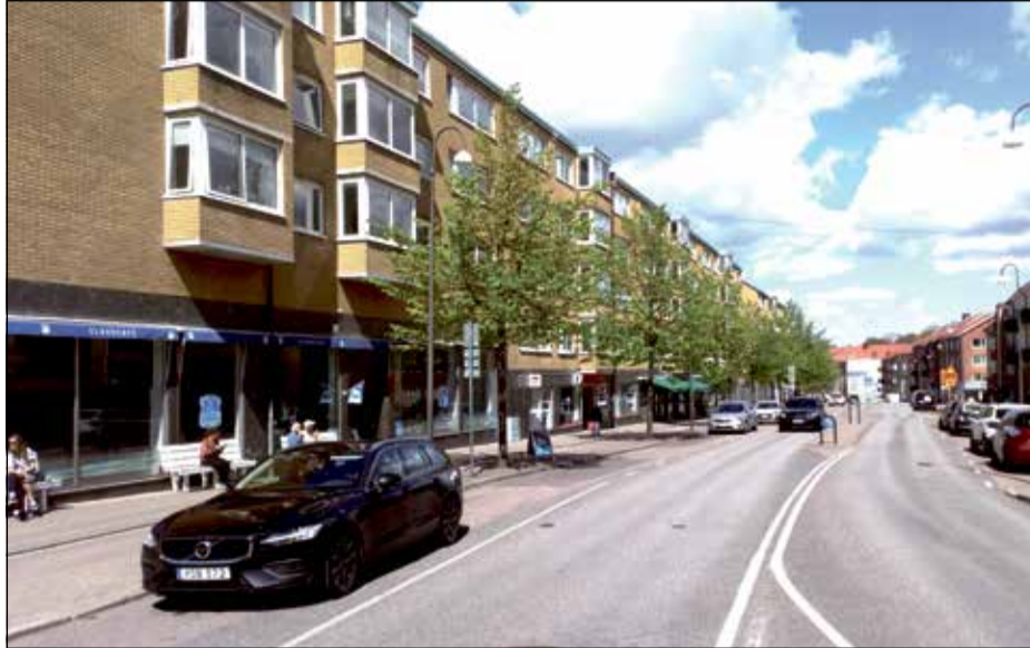
HÄST- ELLER TRÄNGSELSKATT? Danska Vägen i moderna tider. 1733 års taxa för vad hyrkuskar med häst och kärra fick betala för att köra här är inte längre aktuell.