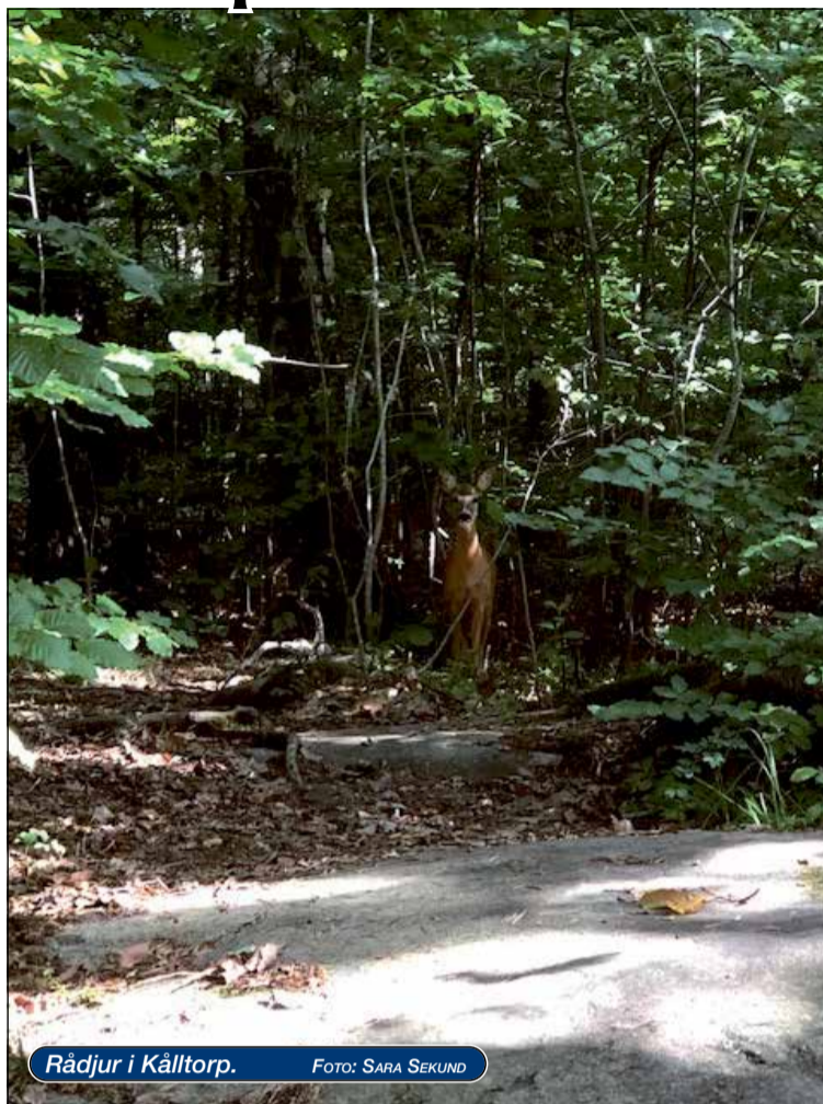
Rådjur i Kålltorp.