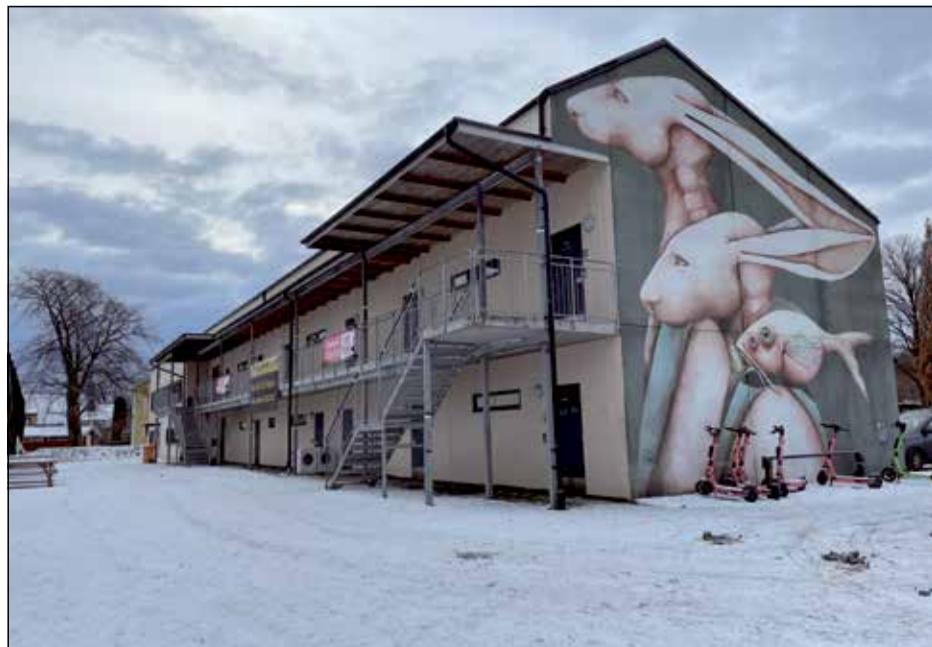
HÄR i Härlanda Park kommer den nya Hjärtstartaren att placeras.