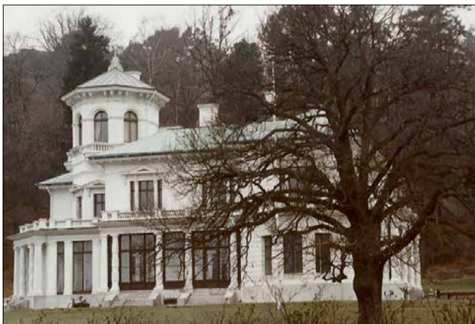
INTE GAMMAL SOM GATAN. På Danska Vägen 20 har Villa Överås stått sedan 1861, men gårdarna Underås och Överås fanns långt innan man år 1724 begärde att få vägen anlagd.

"Projektet Danska Vägen bidrar till bostadsförslinjningen i Göteborgs Stad. Staden förbereder kommande bostadsbyggnation för en ökad inflyttning i området."