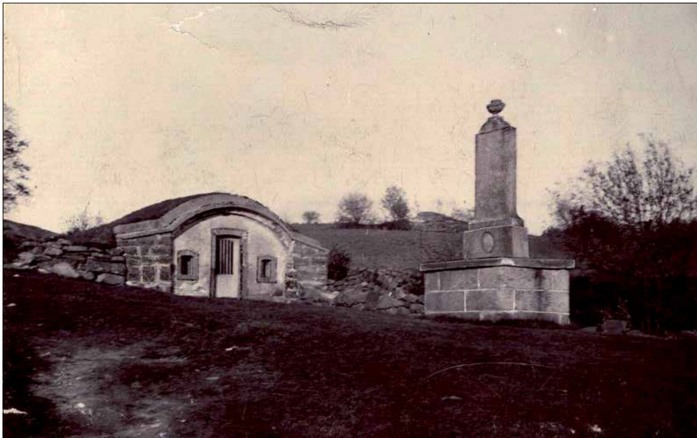
KALLEBÄCKS KÄLLA med minnesstenen, årtal uppges ej.

E-handel: Varför köper så många kunder kläder på nätet? Jo, man får sin HEMMADRESS till sin HEMADRESS!