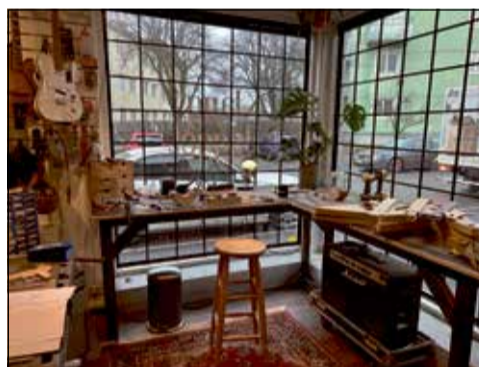
ARBETSHÖRNA. Klang i Bygget har en given plats med fönster ut mot gatan. I samma lokal finns också gitarrbutiken Kapten Gitarr.